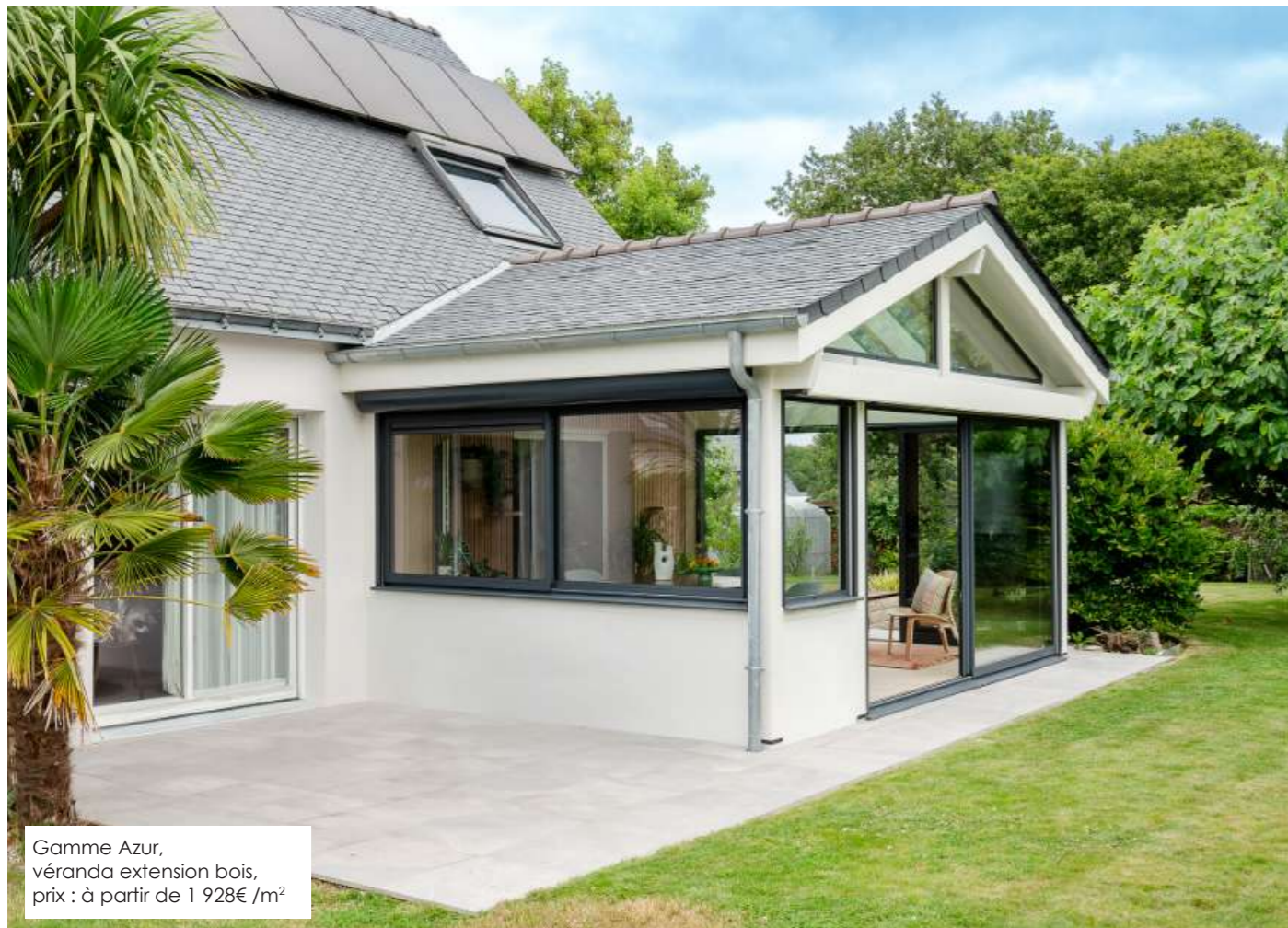
Gamme Azur, véranda extension bois, prix : à partir de 1 928€/m 2

Visuels HD sur demande : contact@julienmansanet.com