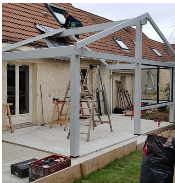
Pose d'une extension bois chez un particulier.