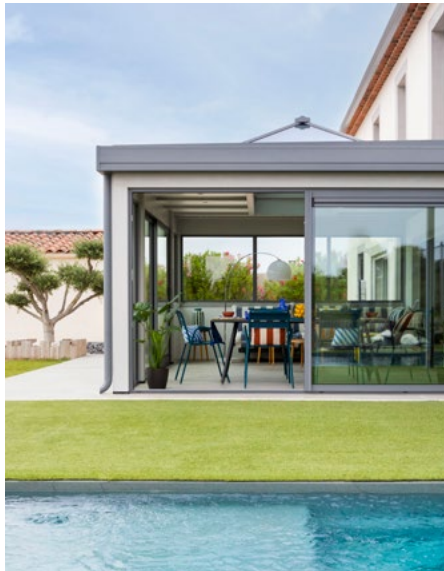
Extension bois Alizé toit plat, Vie & Véranda.