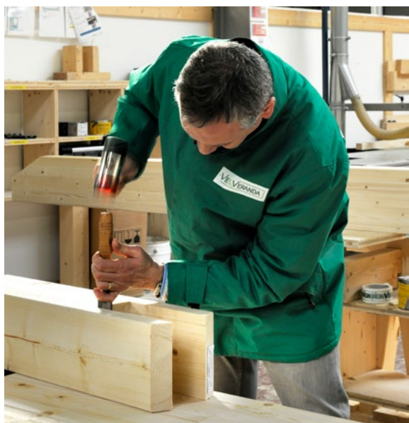
Finitions sur sections en bois à l'usine Vie & Véranda (Feyzin, 69).

* Article Mag SMC2 du 02/05/2014, Construction en filière sèche : une filière d'avenir