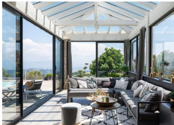
Extensions bois Nature, Vie & Véranda.