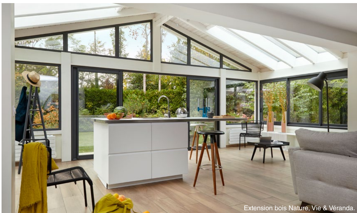
Extension bois Nature, Vie & Véranda.

Spécialiste de la véranda bois depuis plus de 40 ans, Vie & Véranda ne cesse d'innover et d'investir dans ce matériau résistant et durable pour proposer des solutions d'extension toujours plus performantes.