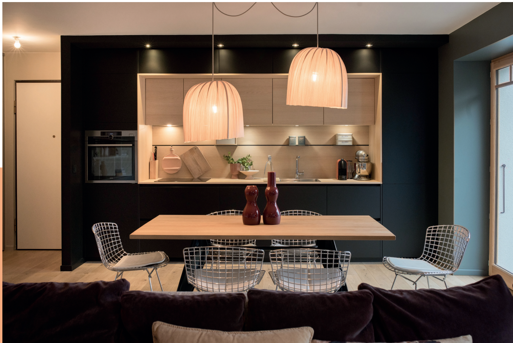
Cuisine modèle Kiffa - Modèle Méliá noir mat sans poignée, façades mélaminé chêne de Bourgogne structuré, plan de travail stratifié chêne de Bourgogne structuré

Pauline et Gabriel peuvent désormais mettre les petits plats dans les grands lorsqu'ils reçoivent du monde. Le projet auquel ils aspiraient a pris vie dans leur intérieur avec cette cuisine ouverte éminemment moderne, discrète en termes de place mais qui sait se faire remarquer par sa beauté et son allure. Une cuisine unique, à leur image.