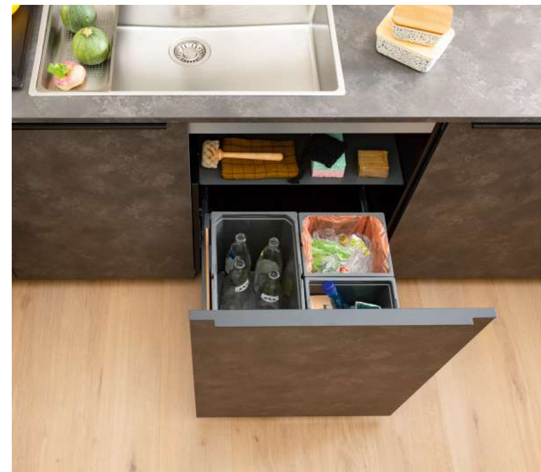
Avec un ou plusieurs bacs, la poubelle de tri intégrée n'encombre pas la cuisine.