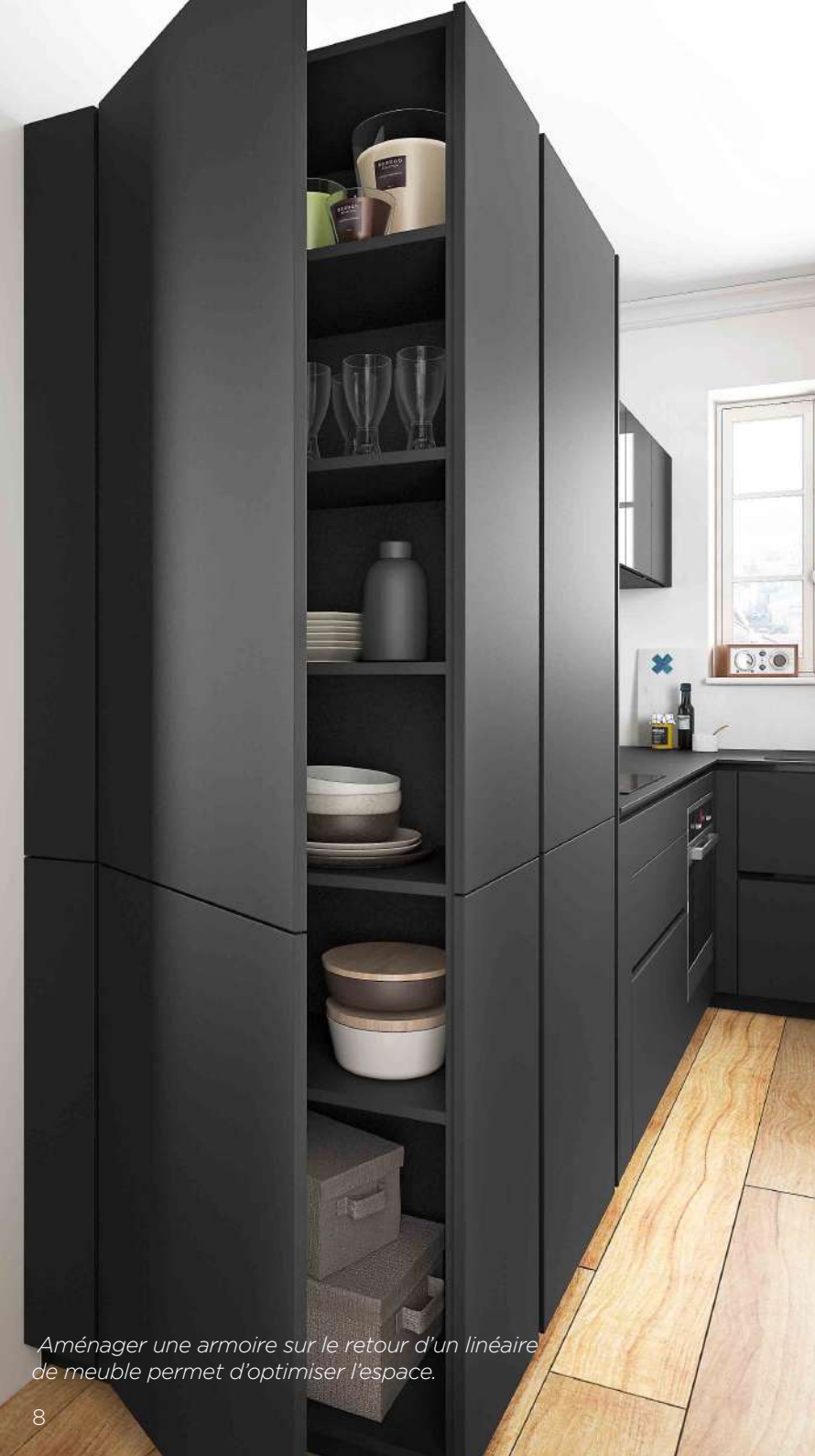
Aménager une armoire sur le retour d'un linéaire de meuble permet d'optimiser l'espace.