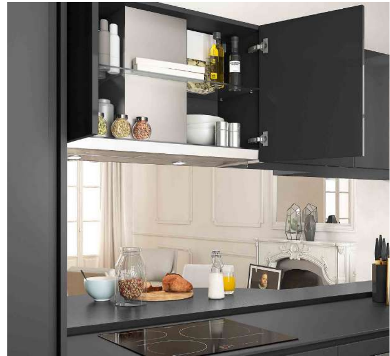
Le meuble dissimulant la hotte sert également, avec ses deux étagères, de rangement.