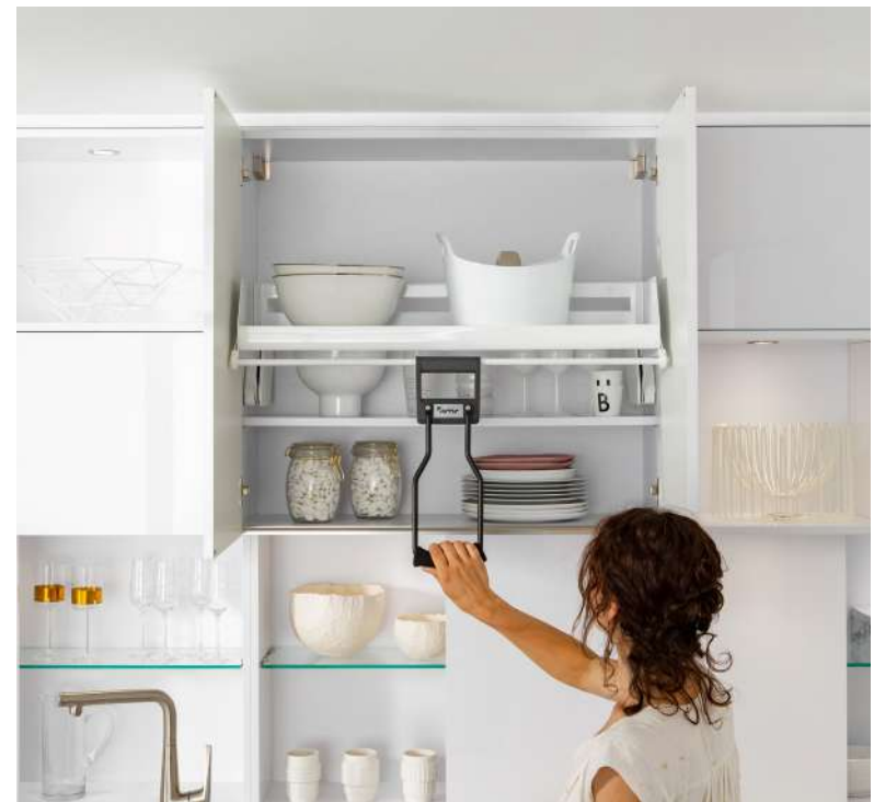
Un système manuel facilite l'accès au contenu des étagères en hauteur.