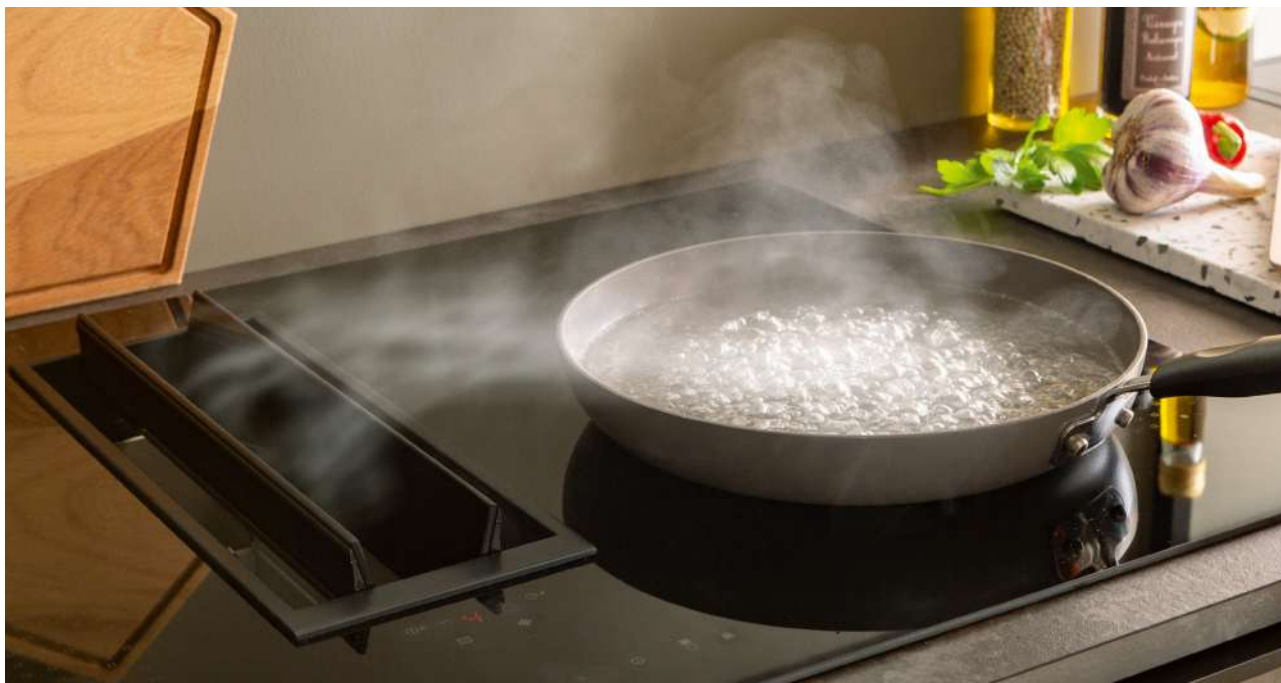
Intégrée dans la plaque de cuisson, la hotte se distingue sans prendre de place.