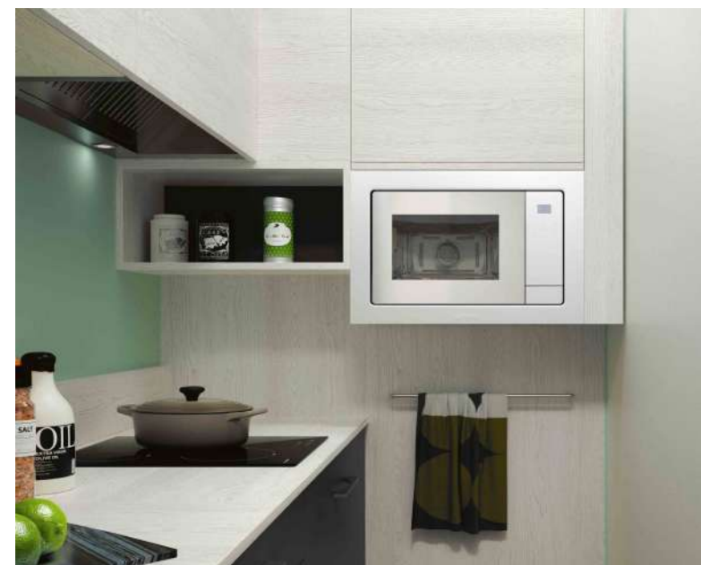
Le petit électroménager se fond dans la cuisine lorsqu'il est encastré.