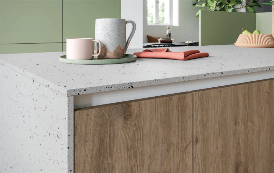
Une association de coloris doux, olive mat, blanc porcelaine, décors Terrazzo et chêne ambré