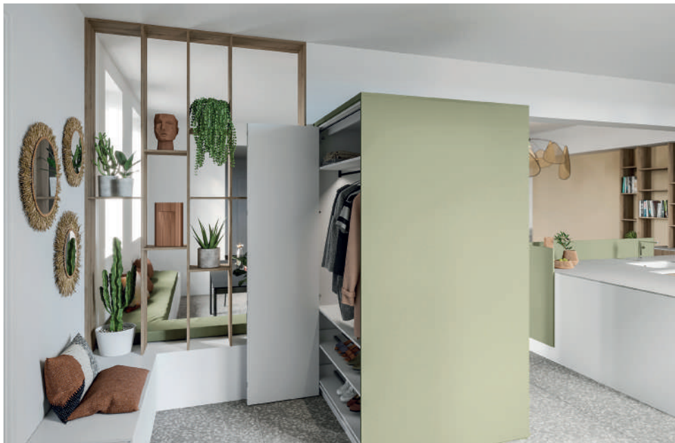
Une implantation qui regorge d'éléments sur-mesure dont un dressing dans l'entrée