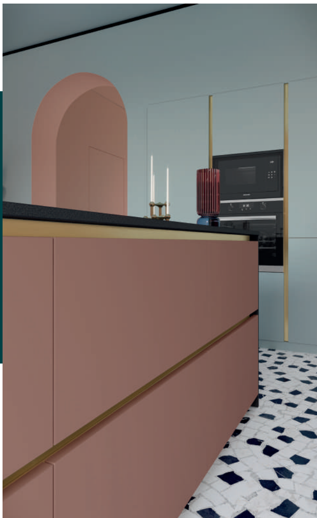
Des profils sans poignées au rendu très chic avec leur finition laiton.