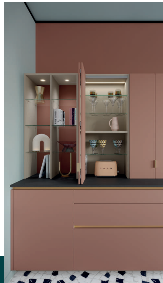
Des étagères vitrées sous LED qui laissent rayonner vaisselle et éléments de décoration