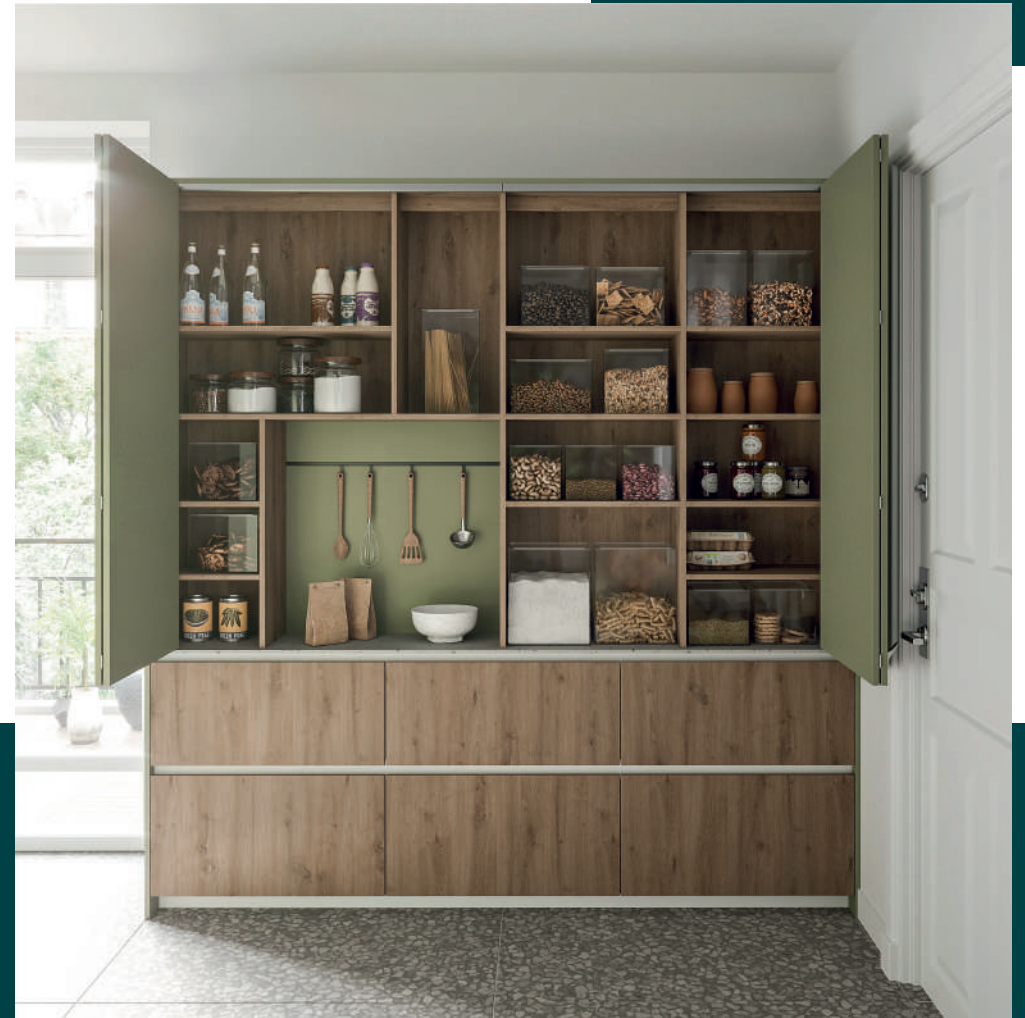
Un garde-manger fonctionnel qui invite au stockage des aliments secs en vrac.