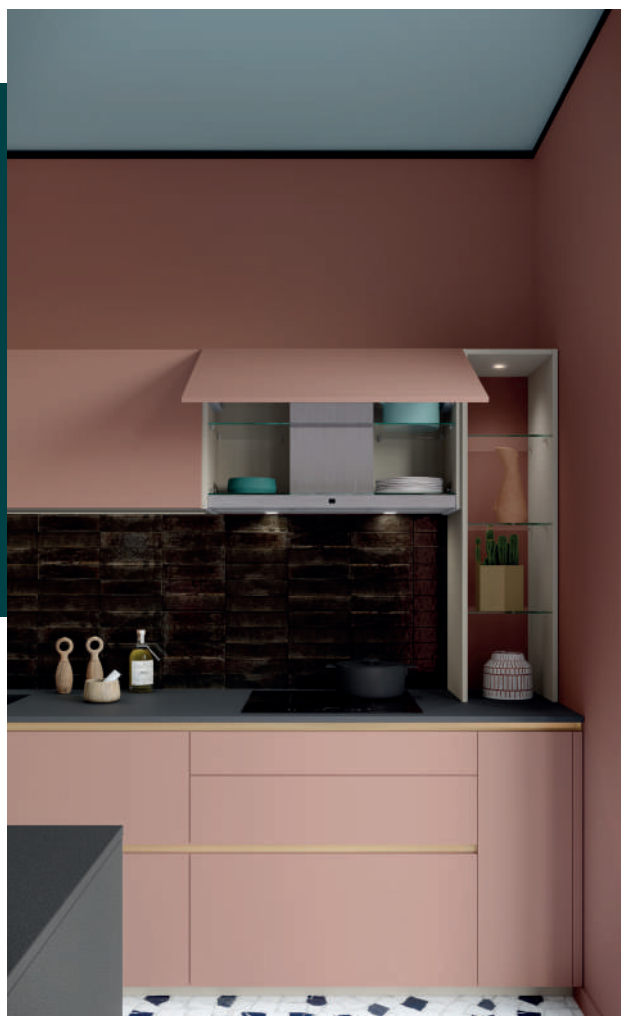
Une hotte intégrée dans un meuble haut pour ne pas rompre l'effet monobloc