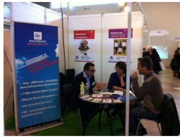
Salon de l'Entreprise Midi-Pyrénées