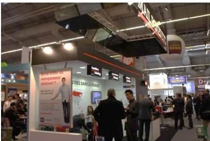
Franchise Expo Paris