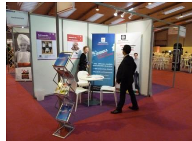
Salon Création reprise d'entreprise Rennes

▪ Nous comptons aujourd'hui 7 Centres en France. Nous avons ouvert 3 nouveaux Centres à Villeurbanne, Clermont-Ferrand et Levallois-Perret. Ces nouveaux franchisés ont en amont de leur ouverture été accompagnés par nos équipes pour aménager leurs Centres et ont suivi une formation de 7 semaines alliant pratique en magasin et théorie au Siège de l'enseigne à Issy-les-Moulineaux. Dans le même temps notre réseau à l'international a progressé d'une cinquantaine d'unités (passant de 1394 à 1441 Centres dans le monde).