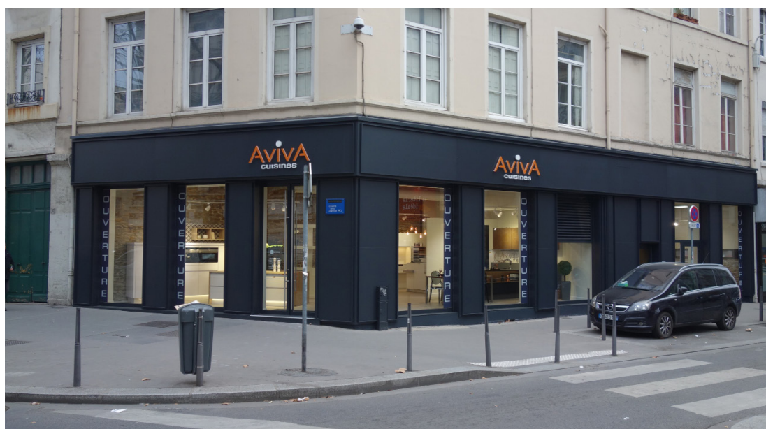
Le magasin pilote AvivA Inside situé Cours de la Liberté à Lyon 3ème

AvivA Inside est un nouveau concept d'enseigne, adapté à des surfaces plus réduites (à partir de 90m 2 ) comme les centres-villes et les petites agglomérations. Sans perte d'expérience client, l'offre a été repensée, pour présenter l'ensemble des produits Cuisines AvivA en seulement 3/4 expositions, avec un processus de vente et d'achat entièrement digitalisé. Ce concept de magasin existe pour apporter un service de qualité et de proximité, en proposant des services et un niveau de finition exclusifs. La promesse AvivA Inside est simple : « le meilleur de Cuisines AvivA, au plus proche de vous ».