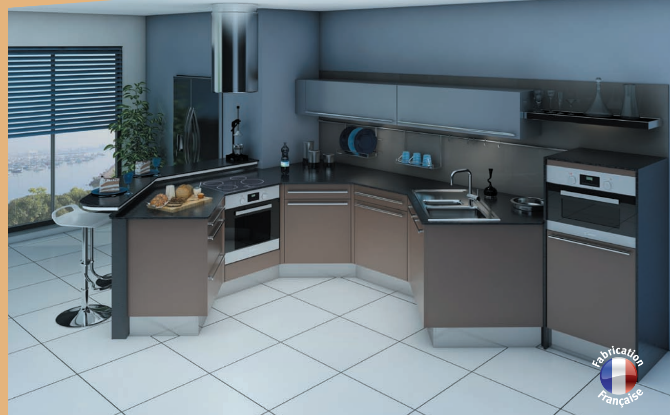
Antarique Façade panneau de particules surfacé mélaminé mat

Compacte et design s'intégrant parfaitement au salon