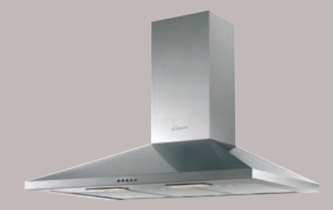
1 Hotte déco 90 cm trapèze Réf. CCE19X