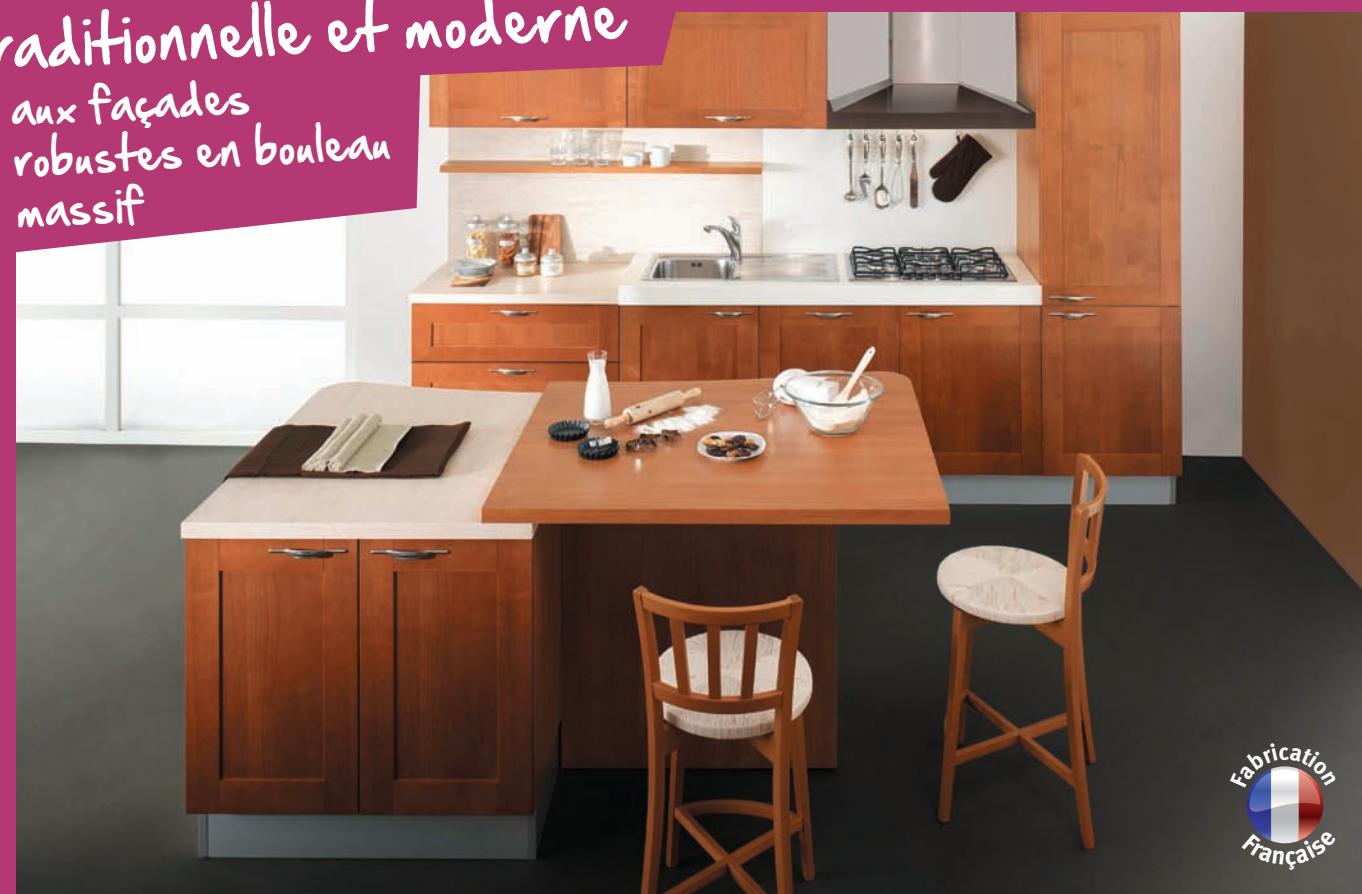
Bosphore Façade cadre droit bouleau massif replaqué cerisier avec panneau central plaqué cerisier

Traditionnelle et moderne aux façades robustes en bouleau massif