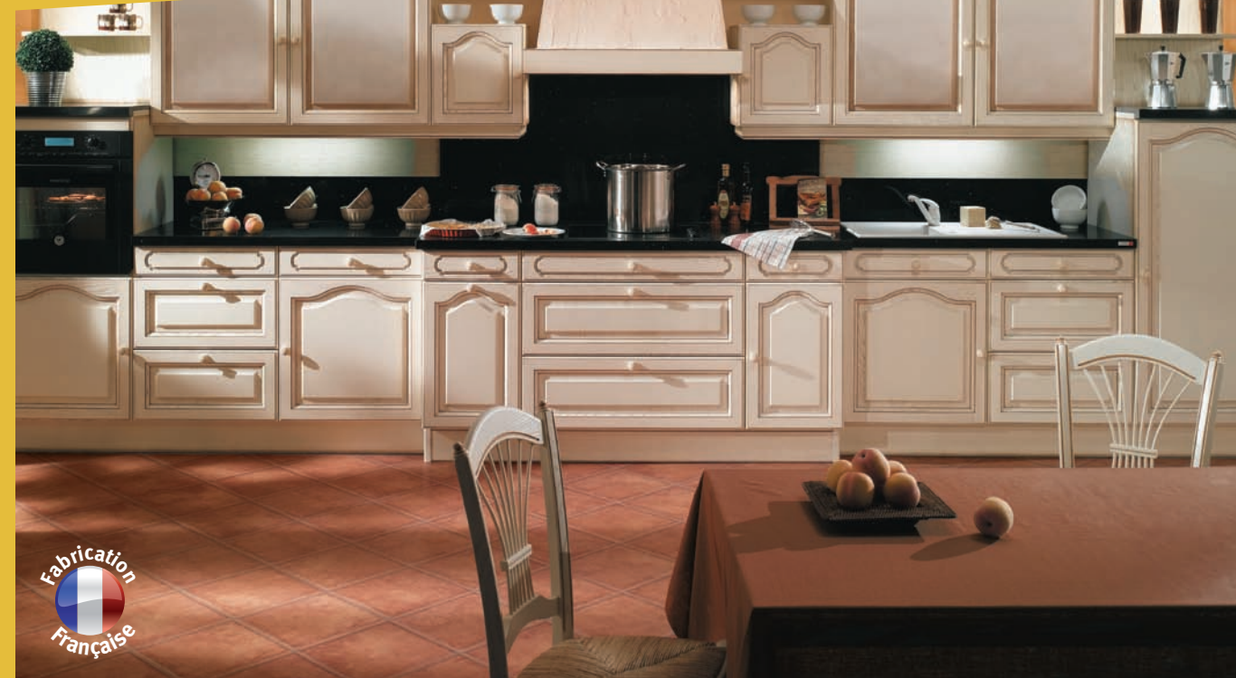
Valbonne Façade frêne massif avec panneau central lamellé frêne

Équilibrée et symétrique pour cette belle cuisine en frêne massif