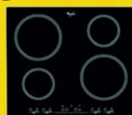
Table induction 4 zones ACM623NE H 56 X L 580 X P 510 MM • 4 foyers 4 boosters • Puissance totale : 6 000 W

Four multifonction catalyse AKP250IX H 595 X L 595 X P 560 MM • Nettoyage par catalyse • Chaleur tournante • Classe d'efficacité A • Consommation d'énergie (kWh) : 0,79