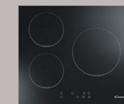
1 Table induction 3 foyers Réf. Cl630C/1