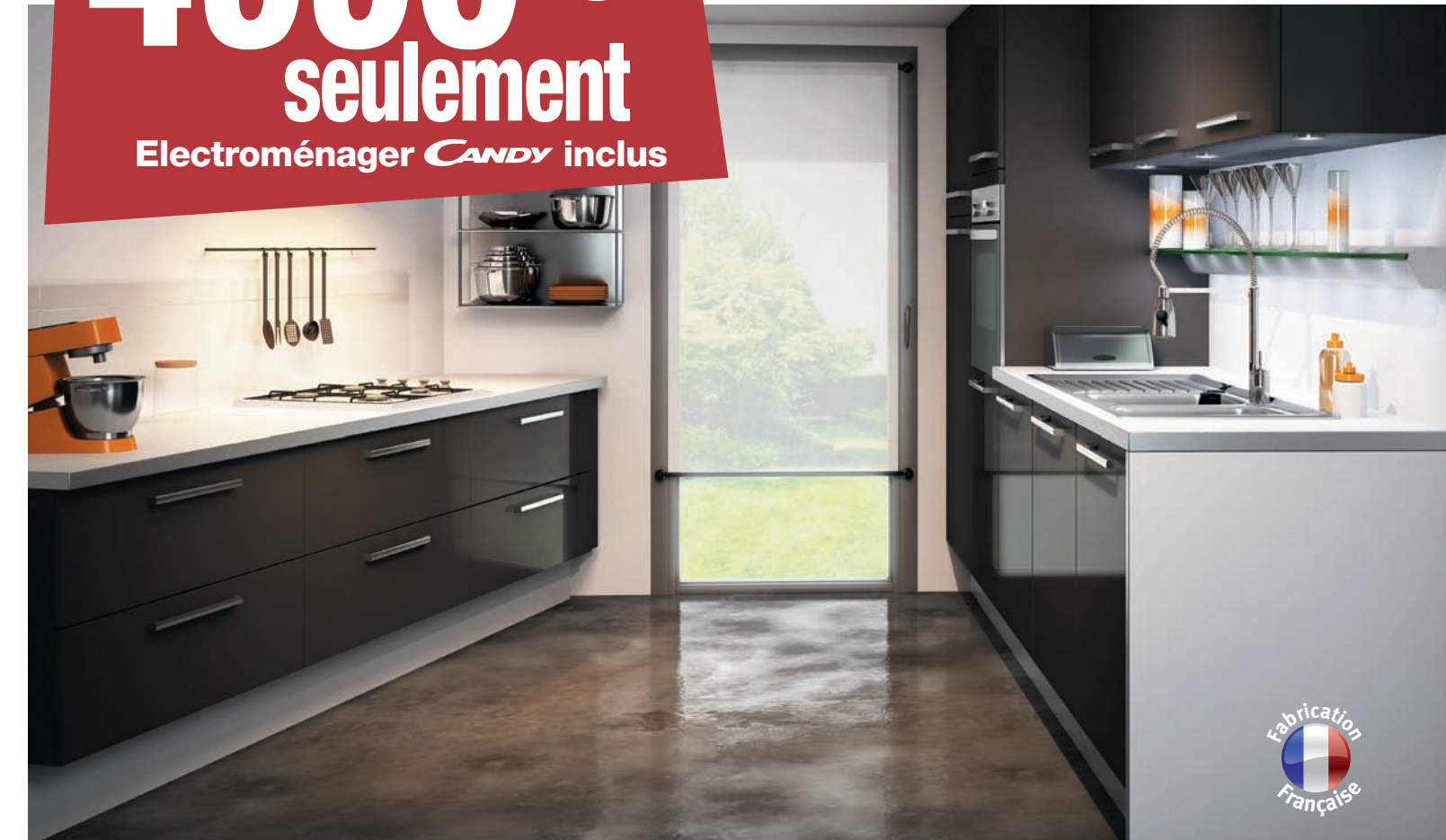
Alabama Façade acrylique sur support panneau de particules - coloris CHG Platine Brillant Plan de travail stratifié avec chant droit PVC - coloris BCG Blanc et chant ABR Décor Alu 3D

Offre promotionnelle hors soldes du 27 juin au 15 août 2012