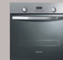
1 Four convection catalyse Réf. FST247/1X