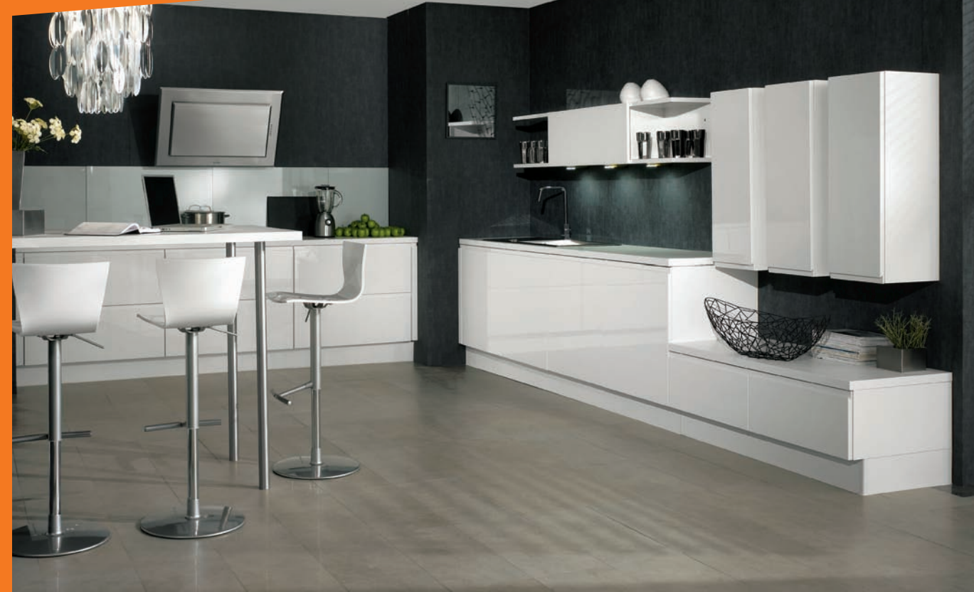
Click Façade laquée sur support MDF

Contemporaine et épurée aux façades ultra-brillantes