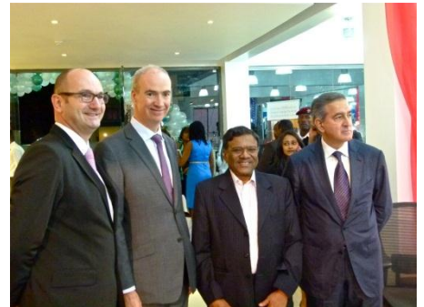
L'inauguration officielle s'est déroulée le 28 novembre 2012 à Nairobi .