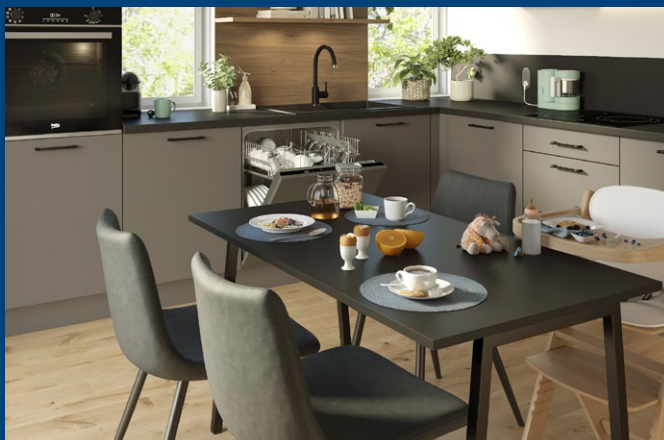
Table : 990 €

Offrir aux clients des solutions clés en main pour leurs projets d'aménagement intérieur.