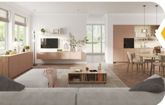
Meuble TV : 1 299 € / Buffet : 1 799 €

salon (meubles TV, tables basses, bibliothèques), salle à manger (tables, chaises, buffets), meubles de salle de bains, dressing, buanderie, bureau... Et comme toujours pour ixina, la qualité est au cœur de l'offre, avec des produits fabriqués et montés en usine en Allemagne.