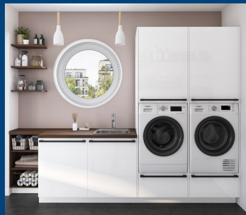
Buanderie : 3 990 €

Cette démarche commence par l'extension naturelle de l'offre depuis la cuisine vers les autres pièces de vie : salon et salle à manger, avec pour objectif ultime de proposer une gamme complète d'aménagements personnalisables de qualité.