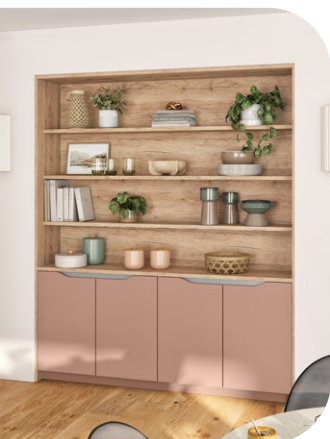
Bibliothèque : 3 390 €