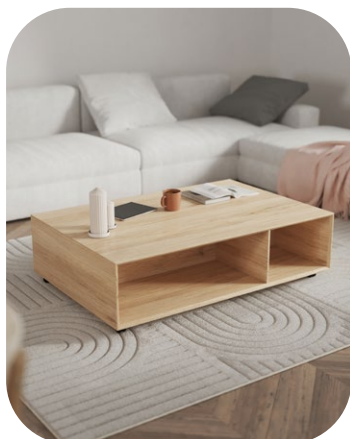
Table basse : 459 €