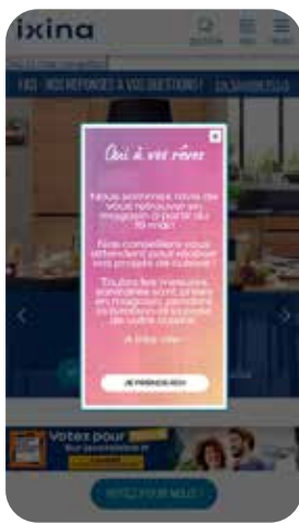
Redirection sur le site internet pour favoriser les rendez-vous.

Mais c'est en mars 2021, avec la fermeture des commerces dits “non essentiels”, que la stratégie drive-to-store bascule en stratégie drive-to-web . ixina et Vectaury déploient un accompagnement sans faille aux franchisés de la marque.