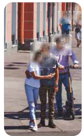
Affinage des cibles et ajout d'une audience